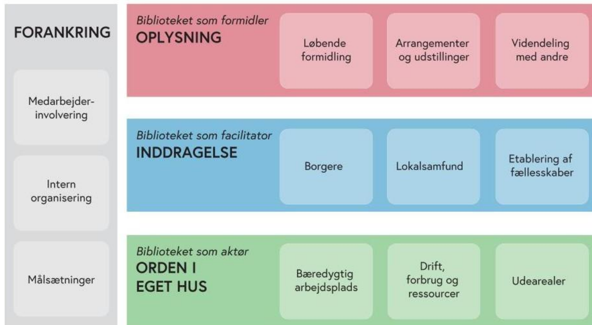
Model for verdensmåls certificeringen

Moellen er opbygget med 4 kategorier hver med 3 underkategorier, i alt 12 punkter: