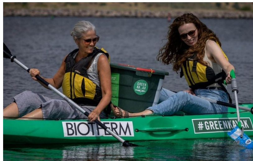
Miljøpunkt Amager, oprydning – fra Kompendium i NCM's Prosperous Future project om grønne mål, 2023 - 2024