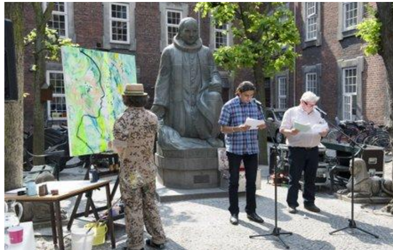
Cultural project event in the yard of Vartov, Copenhagen