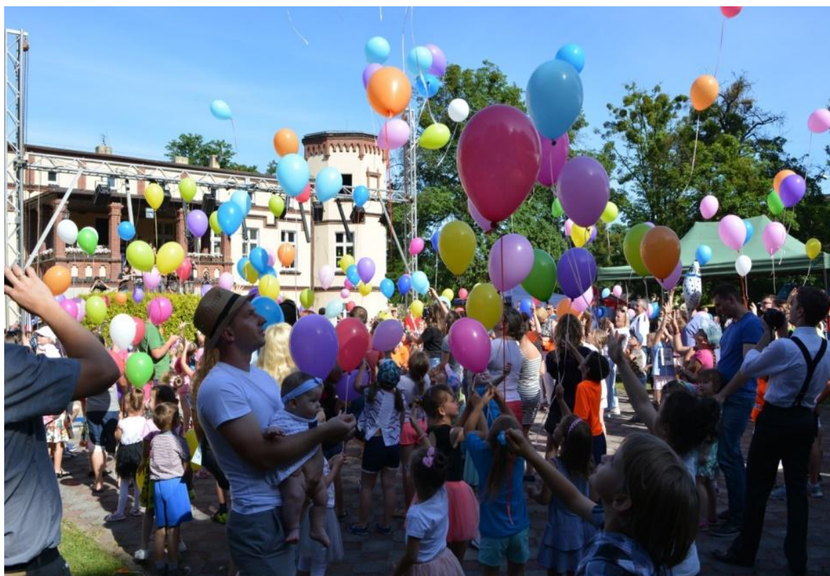
Balloons in the air for the 700th anniversary of Czernica Village

Czernicos kaimas turi ilgą istoriją. 2017 metais jis atšventė 700-ąją sukaktį nuo kaimo įkūrimo. Pilotiniam darbui „Spichlerz Asociacija“ pakvietė vietinių aktyvių grupių bei gyventojų ir šiai sukakčiai suorganizavo keletą renginių.