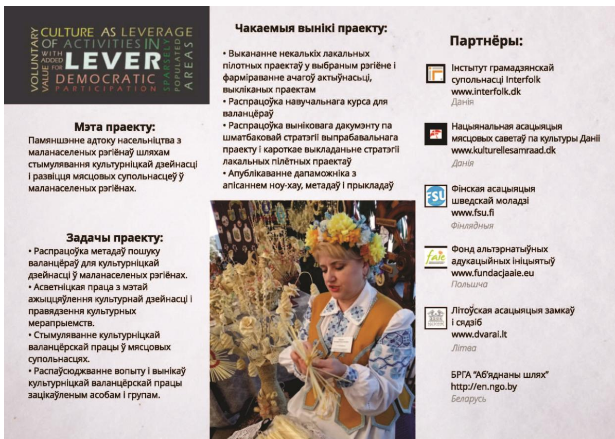
Belarusian Leaflet for the LEVER project

organizuotuose jų efektyvumui ir vaidmenims įvertinti, pasikeisti informacija, diskusijoms apie būdus užtikrinti pilotinių darbų tvarumą.