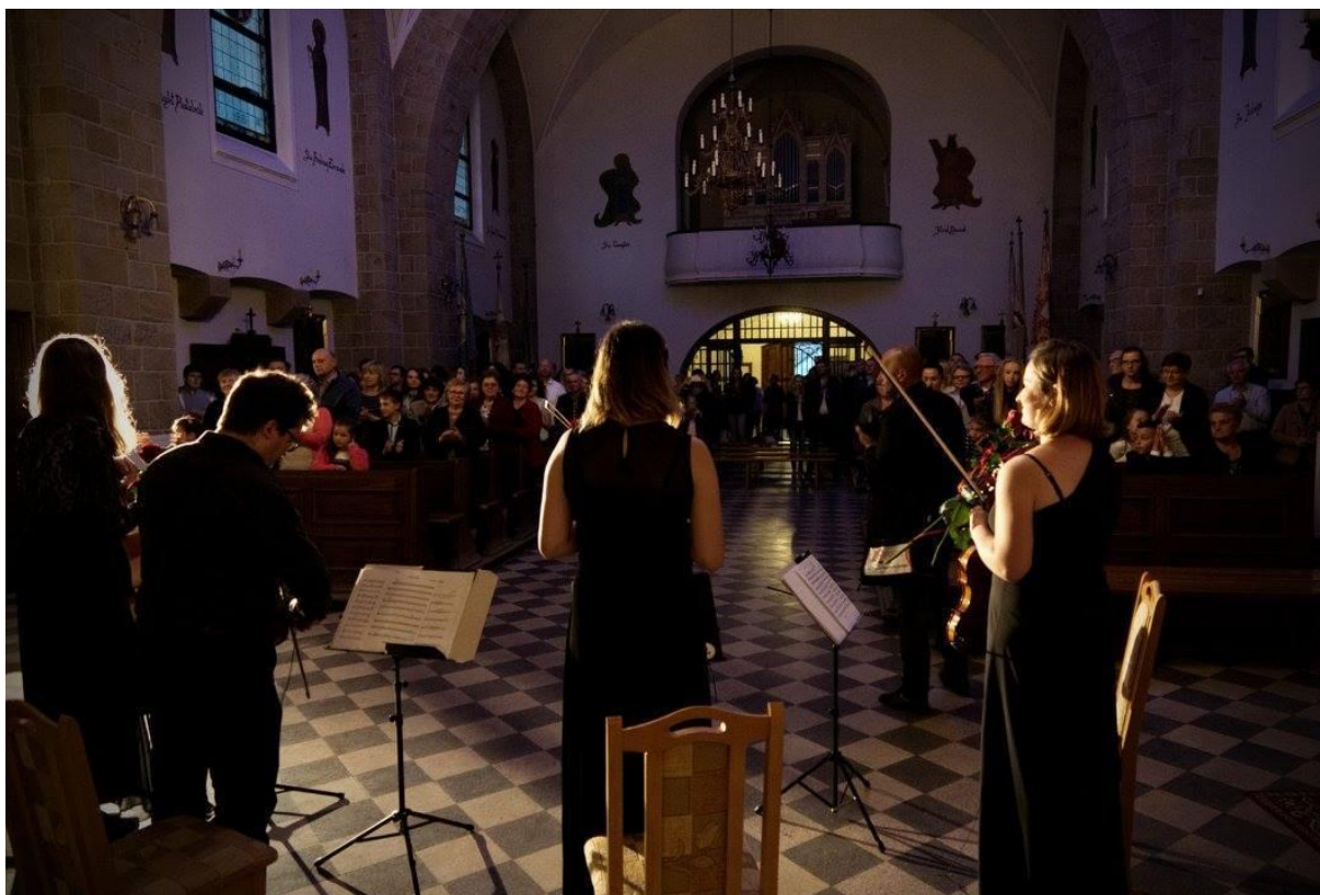
Classical & film music concert.

suformuotas kaip naturalus amfiteatras, vietinės bendruomenės nariai jį laiko vertingu turtu. Jie sugalvojo panaudoti parką kultūros renginių organizavimui. Pirmasis jų žingsnis buvo nutarti, kaip įregistruoti organizaciją, kaip fondą ar kaip asociaciją. Grupė taip pat bendradarbiavo ir buvo palaikoma vietinių įtakingų asmenų bei turėjo didelę motyvaciją dirbti vietinei bendruomenei (kurti dalykus, kurie ir jiems patiems yra įdomūs).