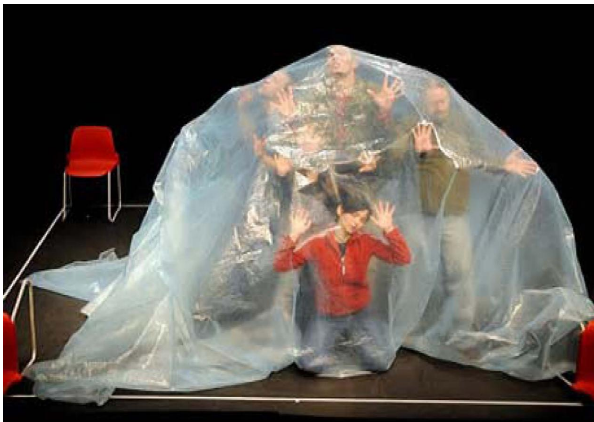
Theater play in Belarus

Remiantis preliminarium kaimo sektoriaus mini tyrimu, kuris atskleidė daugybę problemų (nuo ekonominių ir struktūrinių iki demografinių, socialinių ir kultūrinių), mes turėjome nuspręsti, kokiai veiklai kaimo gyventojai pritaro.