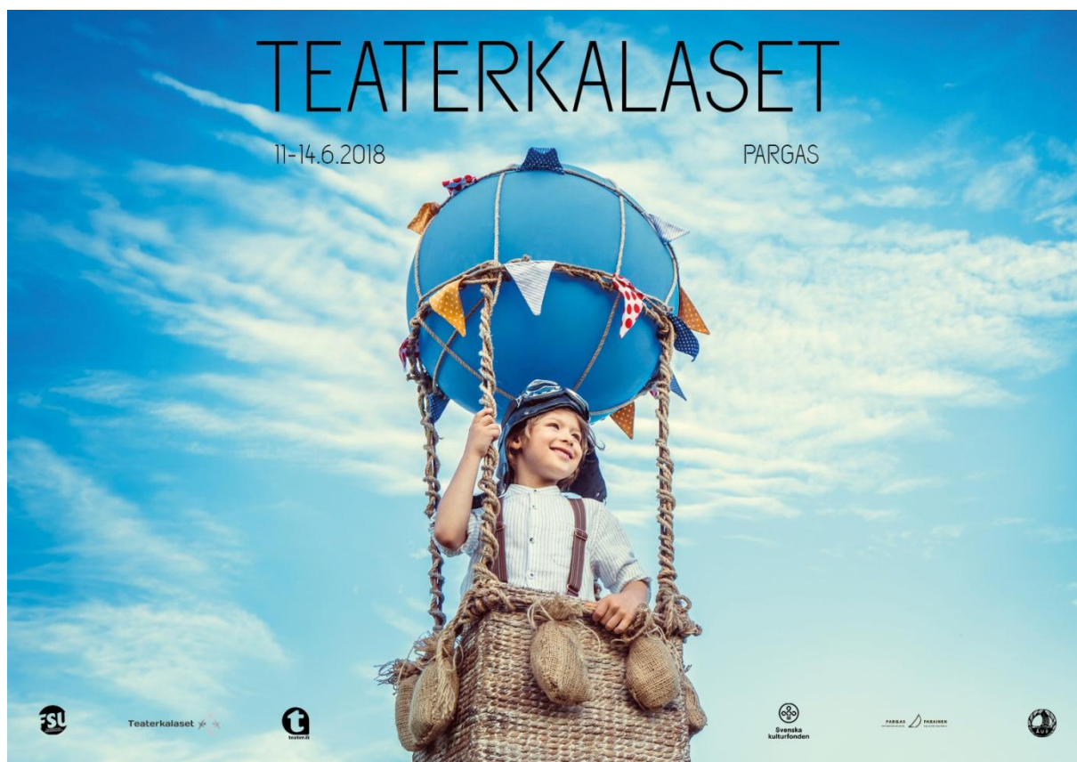
Poster for the Teatre Festival in Pargas 2018

Bendras šio pilotinio darbo tikslas buvo suaktyvinti kaimo gyventojus, asociacijas, kad jie imtusi iniciatyvos vystant gyvenimą savo pačių vietovėse. Tikslas buvo vystyti kaimo vietovių funkcionalumą ir patrauklumą, gyvenimui ir darbui. Mūsų projektas skatina ir drąsina bendradarbiavimą tarp žmonių ir organizacijų.