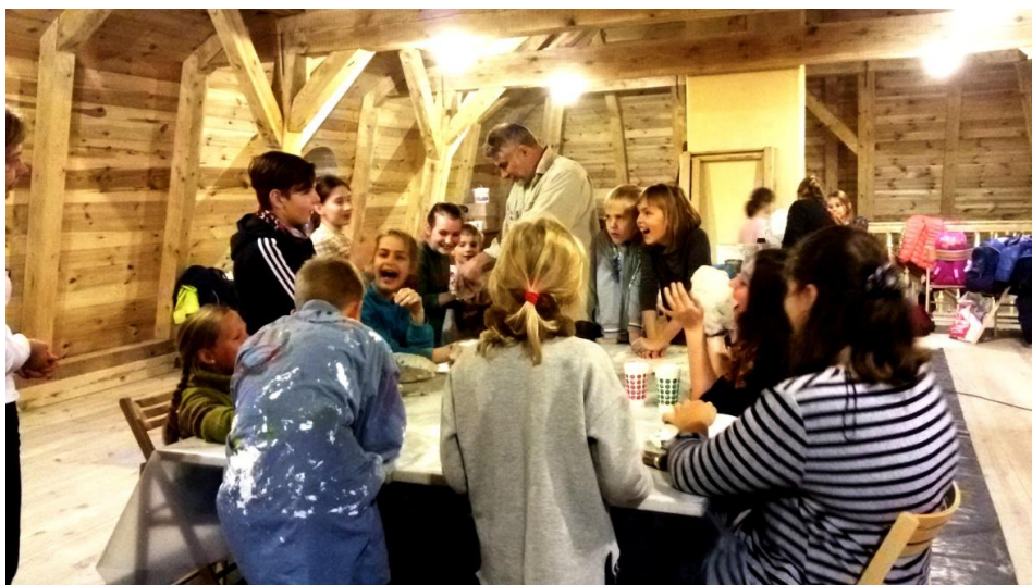
Antropomorphic candle molding at Liubavas manor

Liubavo dvaro pilotinė komanda bendradarbiavo su vietos pagrindinio ugdymo mokykla ir Vilniaus Vienožinskio meno mokyklos mokytojais bei mokiniais. Buvo sukurta nauja originali edukacinė programa – antropomorfinių žvakių liejimas. Tai buvo nauja patirtis vietiniams vaikams, o vėliau jie galėjo didžiuotis savo rezultatais, eksponuotais baigiamajame kultūriniame Liubavo dvaro renginyje.