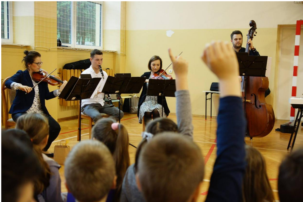
Workshops for the school kids, Góra Ropczycka, October 2017.

Vienas iš didžiausių iššūkių bendradarbiaujant yra Lenkijos nevyriausybinių organizacijų raida: daugelis NVO veiklose dalyvaujančių nedirba jose, tačiau savanoriauja. Taigi jie turi dirbti ir kažkur kitur, o tai apriboja jų galimybes skirti laiką projektams NVO. Padeda motyvacija ir realus šių aktyvių žmonių įtraukimas, pagalba jiems realizuoti savo interesus dirbant vietos bendruomenių naudai.