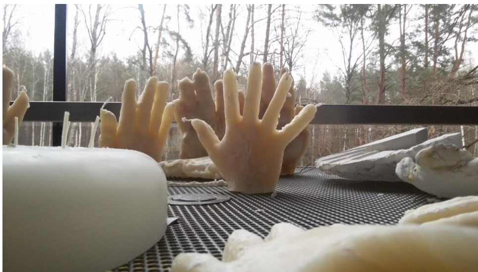
Antropomorfinės žvakės Liubavos manore

Projekto metu vykdytos veiklos buvo organizuojamos kaip meninės dirbtuvės (keramikos, liejimo, tapybos ant šilko ir kt.), koncertų ir pasirodymų. Susitikimų dvaruose kaip vietos kultūriniuose centruose forma, subdominant ir įtraukiant ir vietines bendruomenes, ir svečius.