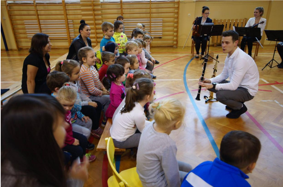
Workshops for the school kids, Góra Ropczycka, October 2017.

Visi suinteresuotieji asmenys dalyvavo peržiūroje: organizatorių komanda, remiantys NVO atstovai, Sędziszów Małopolski vicemeras, vietos kultūros namų direktorius, savivaldybės atstovai, rėmėjai, taip FAIE comandos atstovai. Dalyvavo ir vietos žiniasklaidos atstovai. Buvo aptarti ateities planai organizuoti kitą koncertą 2018 metais, vietos bendruomenė pakviesta bendradarbiauti.