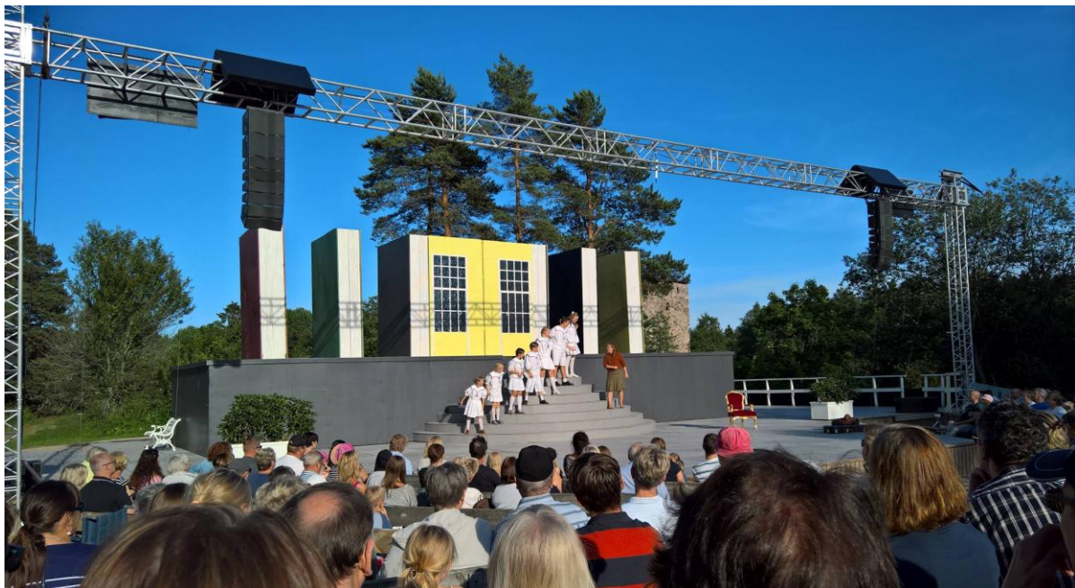
Theatre Boulage and Raseborg Summer Theatre

FSU pradėjo susisiekdama su keturiomis rajoninėmis organizacijomis 2016 metais. Jų atstovai buvo suinteresuoti dirbti kartu ir aptarti bendrą strategiją, kuri būtų naudinga jaunimo asociacijos judėjimui ir kultūros savanoriavimui kaimo vietovėse. Dirbtuvės – mokymai vyko 2017 sausio 28 dieną, Tampere „Hotel Scandic“. Jose dalyvavo 31 dalyvis iš keturių rajoninių organizacijų.