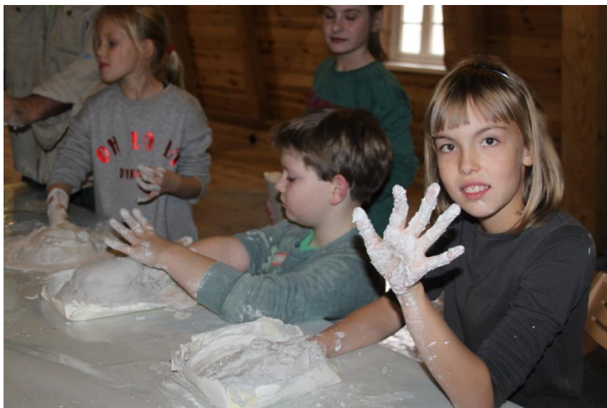
Ceramic workshops for children at Akmena manor

Akmenos dvaro pilotinė komanda organizavo vietos bendruomenę suburiančių, edukacinių, vienijimąsi skatinančių renginių ciklą “sviesto” tema, su keramikos dirbtuvėmis ir kitomis veiklomis, įtraukiant ir vaikus, ir suaugusius.