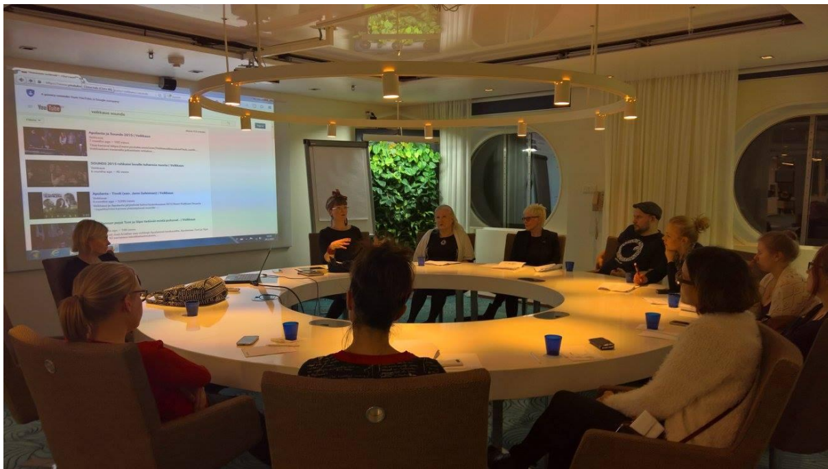
Idea hatchery at a FSU meeting

FSU, turėdami didelę patirtį, surengė dalyviams dirbtuves pavadinimu „Idėjų Inkubatorius“. Kaip atskleidžia pavadinimas, svarbiausias „Idėjų Inkubatoriaus“ tikslas yra idėjų išbaigimas kūrybingomis diskusijomis, kad idėjos kiltų ir būtų toliau vystomos. Pastebėta, jog 20-30 žmonių yra tinkamiausias skaičius siekiant sukurti laisvos diskusijos atmosferą.