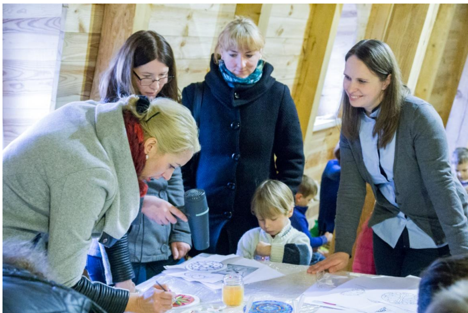
Art workshops at Žeimiai manor

Žeimių dvaro komanda organizavo menines dirbtuves, susijusias su jų įsteigta menininkų rezidencijų programa. Modernus menas kuriamas dvaro erdvėse įvairiausių asmenybių, menininkų, atvykstančių iš įvairiausių vietų, bendraujančių ir dirbančių kartu. Vietos bendruomenės nariai buvo pakviesti dalyvauti, įtraukti į menines veiklas, žmonės čia vienija kūryba.