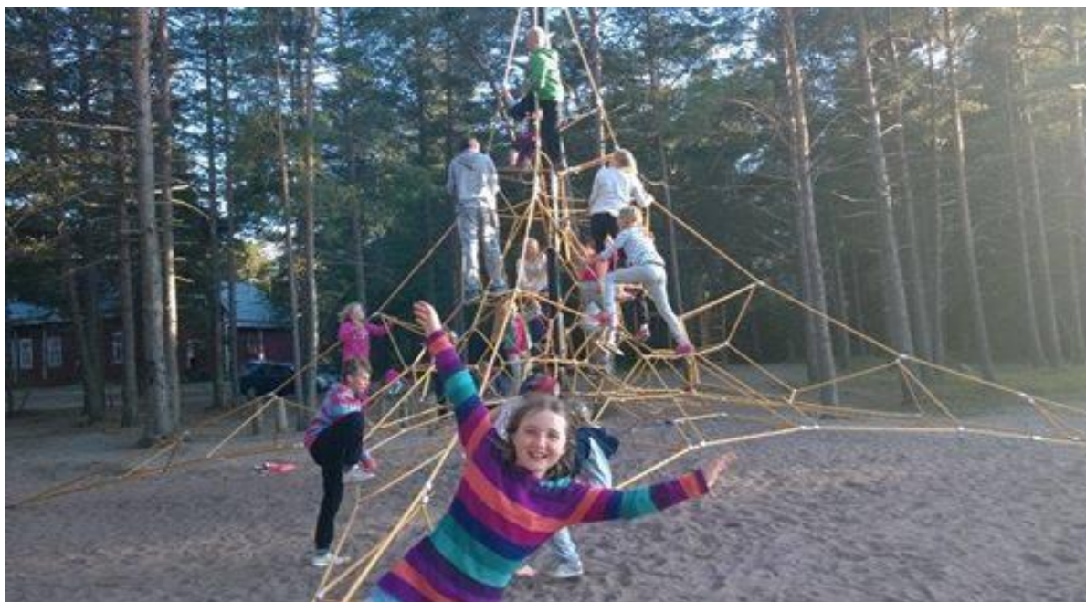
Nature bridging with FSU

Asociacijos, kurios dalyvavo, pateikė trumpą idėjų ir minčių, kurias reikia tobulinti, aprašymą. Mes taip pat paprašėme jų atsiųsti mums savo mintis apie tai, kaip FSU, kaip centrinė organizacija, galėtų jiems geriau padėti. Tokiu būdu mes galėsime geriau pasiruošti veiksmams, kurie tikrai atitiktų jų poreikius.