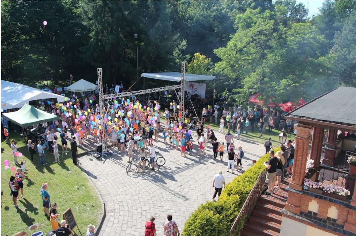
The Historical Street Run with picnic participants.

renginys, kurio organizavime dalyvavo apie 10 įvairių bendradarbiaujančių grupių ir daugiau nei 50 savanorių. Paruoštoje programoje kiekvienas galėjo rasti ką nors įdomaus, o renginys buvo užbaigtas teatro pasirodymu "Czernicos istorijos", kuriam pjesė buvo parašyta remiantis vietos istorijos atradimais. Pagrindinis renginio organizatorius buvo Spichlerz Asociacija, kartu su Gaszowice bendruomene.