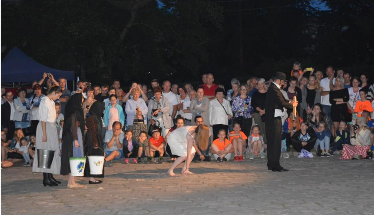
Theatre play based on local history.

Asociacija turi didžiulį potencialą vystyti dėl augančių išitraukusių žmonių grupių (įskaitant savanorius), augančio atpažinomumo ir pagarbos vietos bendruomenei, gerų ryšių su vietos valdžios atstovais ir nuolatinio naujų erdvių kūrimo visiems susidomėjusiems prisijungti prie jų veiklos.