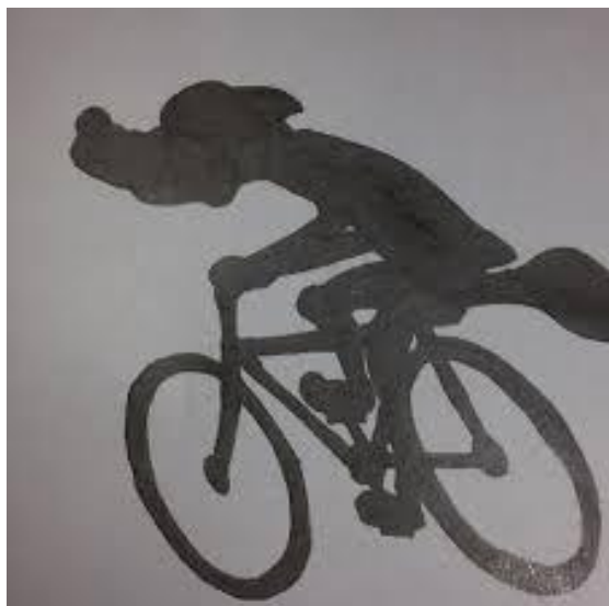
Poster for Tour de Sibbo by UF Kamraterna

kad organizatoriai toliau vystys projektą, ir kad renginys vyks kas metus, galbūt su išsamesnėmis programomis sustojimo vietose. Pilotinis darbas buvo sėkmingas: renginyje dalyvavo 129 žmonės iš 17 asociacijų ir visi 13 asociacijų pastatų atvėrė duris.